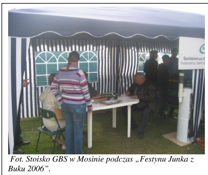
Fot. Stoisko GBS w Mosinie podczas „Festynu Junka z Buku 2006”.