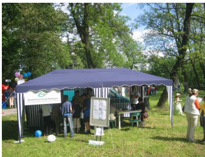
Fot. Stoisko GBS w Mosinie podczas imprezy z okazji „Dni Mosiny 2006”.

Słoneczne majowe dni to czas, który sprzyja organizacji różnego rodzaju imprez plenerowych. W tym miesiącu rozkwitających kasztanów i bzów święto swoje obchodzi także miasto Mosina. W tym roku wzorem lat ubiegłych byliśmy jednym ze sponsorów cyklu imprez związanych z „Dniem Mosiny 2006”. W dniu 20.05.2006r. uczestniczyliśmy w imprezie w Parku Miejskim, gdzie wystawiliśmy swoje stoisko. Zadbaliśmy o to, aby odwiedzający